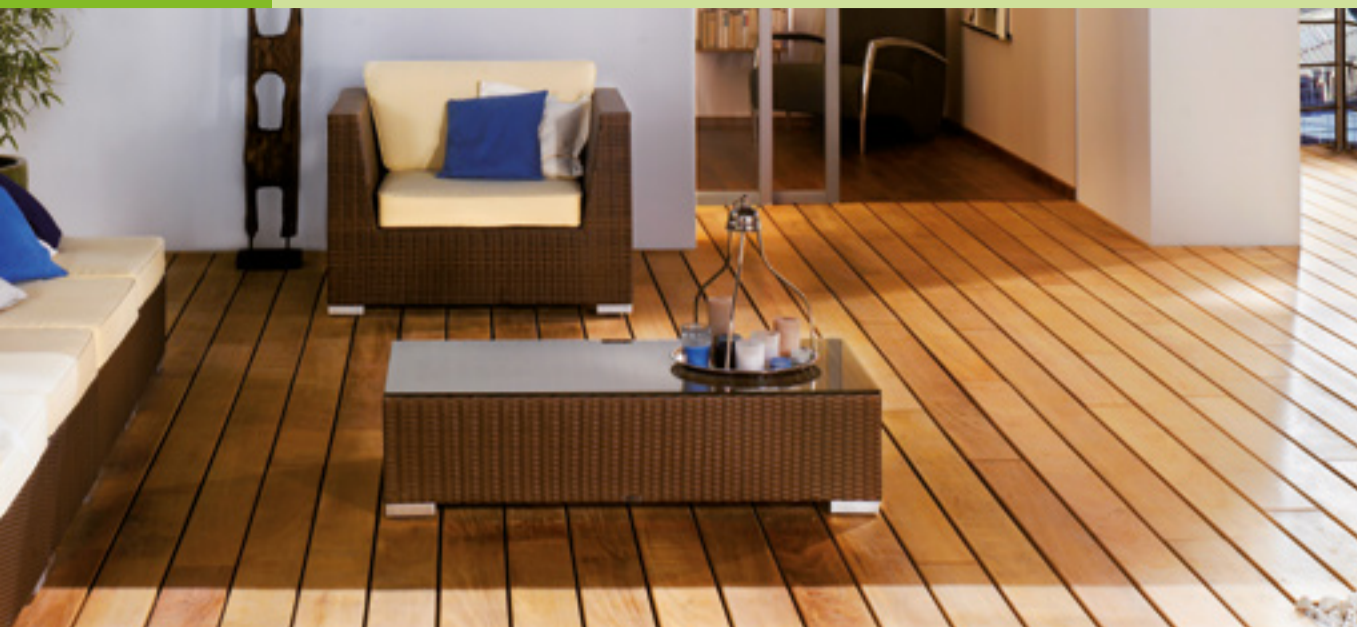
* Žádná UV ochrana

VYVINUTO PRO INDIVIDUÁLNÍ POŽADAVKY UŠLECHTILÝCH DŘEVIN